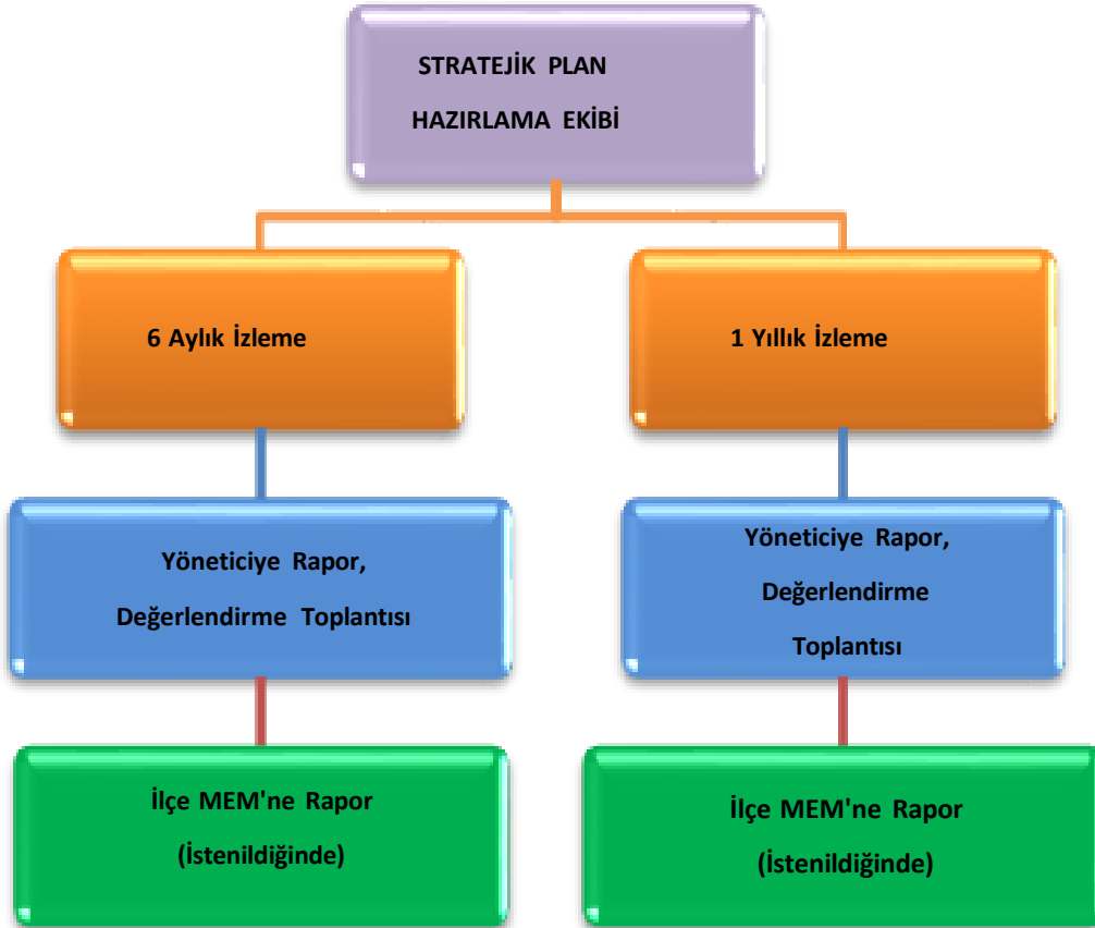
Tablo 35: İzleme ve Değerlendirme Tablosu

Müdürlüğümüzün 2024-2028 Stratejik Planı İzleme ve Değerlendirme sürecini ifade eden İzleme ve Değerlendirme Modeli hazırlanmıştır. Müdürlüğümüzün Stratejik Plan İzleme- Değerlendirme çalışmaları eğitim-öğretim yılı çalışma takvimi de dikkate alınarak 6 aylık ve 1 yıllık sürelerde gerçekleştirilecektir. 6 aylık sürelerde rapor hazırlanacak ve değerlendirme toplantısı düzenlenecektir. İzleme-değerlendirme raporu, istenildiğinde İlçe Milli Eğitim Müdürlüğü'ne gönderilecektir. Ayrıca ilçemizin Mülki İdari Amirine sunulacaktır. 1 yıllık izleme-değerlendirme çalışmaları, Stratejik Planımızda yer alan hedeflerin yıllık düzeyde ifade edildiği Performans Programı ve yılsonunda gerçekleşme düzeylerinin belirlendiği Faaliyet Raporu hazırlanarak yapılacaktır.